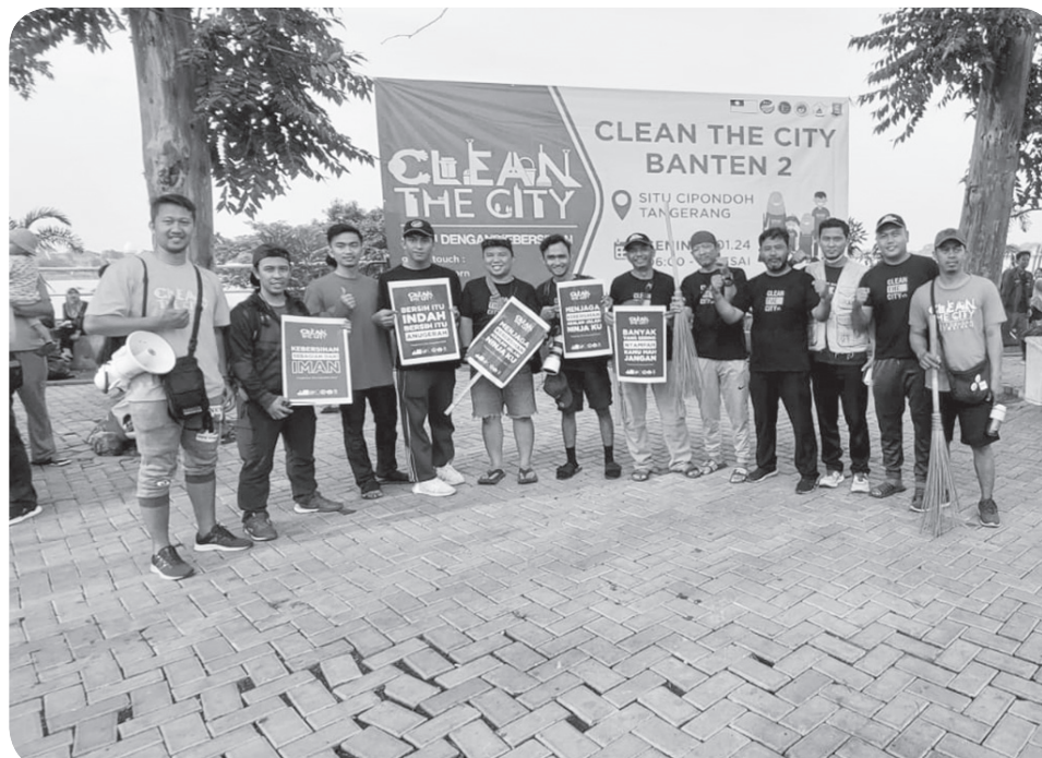
Komunitas Clean the City dalam kegiatan pembersihan sampah di Situ Cipondoh Kota Tangerang.

Di lokasi yang sama Nisa Warga Warung Mangga mengaku senang menjadi peserta CTC ikut membersihkan sampah di Situ Cipondoh. "Saya rasa ini sangat bermanfaat bukan saja buat saya pribadi tapi buat semua masyarakat," ucapnya. ● juh